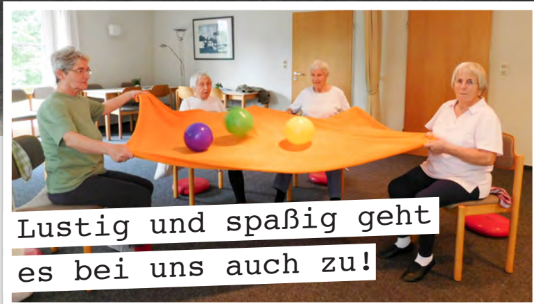
Lustig und spaßig geht es bei uns auch zu!