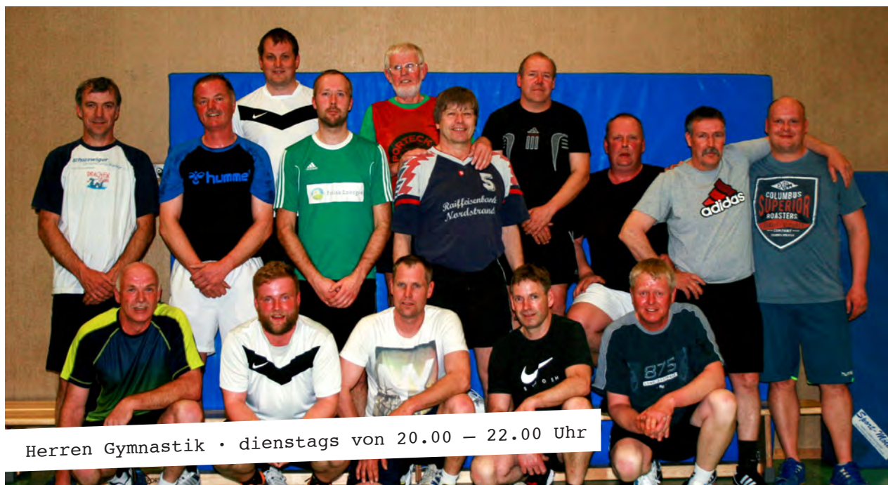
Herren Gymnastik • dienstags von 20.00 – 22.00 Uhr