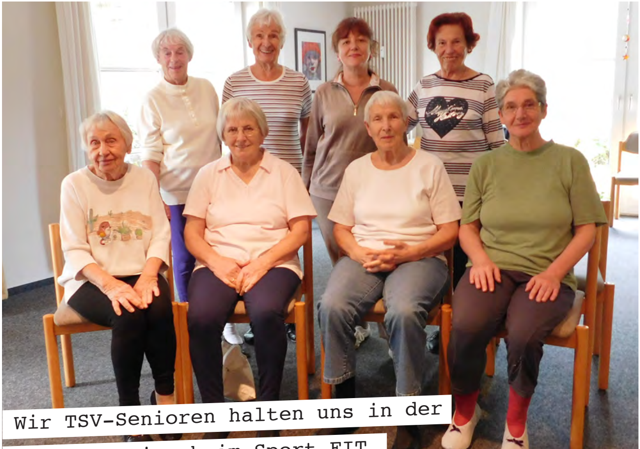
Wir TSV-Senioren halten uns in der Sozialstation beim Sport FIT.