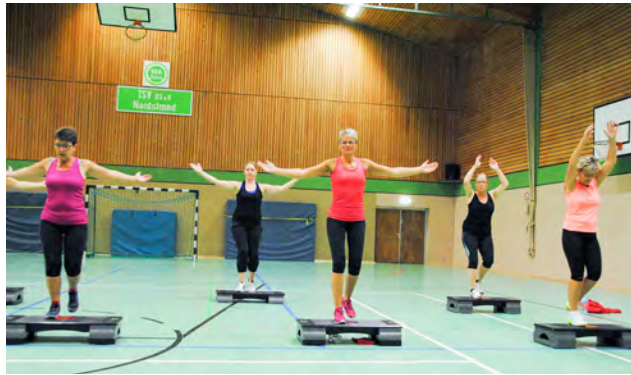
STAPP AEROBIC montags, 17.30 – 18.25 Uhr