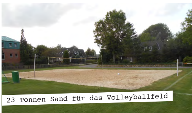
23 Tonnen Sand für das Volleyballfeld