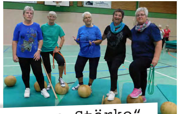
„Vielseitigkeit ist unsere Stärke“