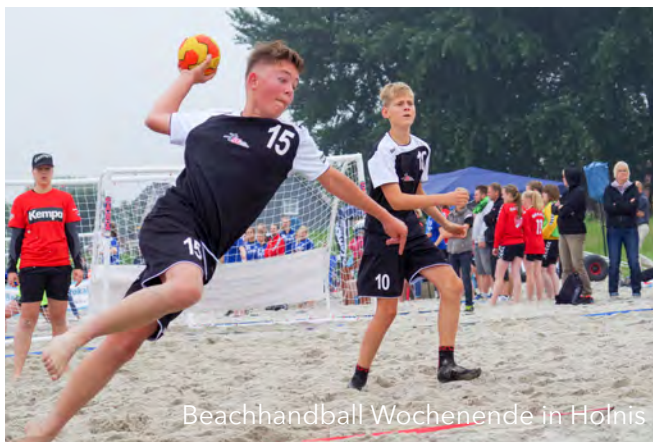
Beachhandball Wochenende in Holnis

verloren dann aber doch im anschließenden Shootout. Im dritten Spiel gegen den Letzten der