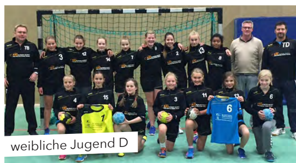
weibliche Jugend D