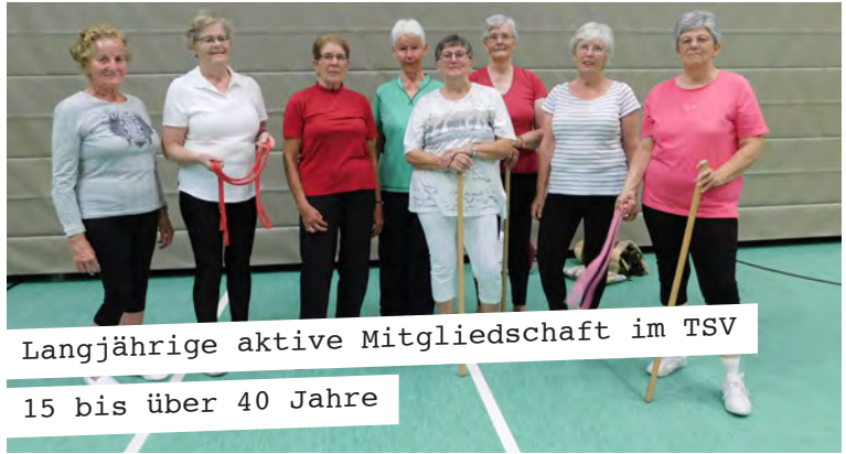
Langjährige aktive Mitgliedschaft im TSV 15 bis über 40 Jahre