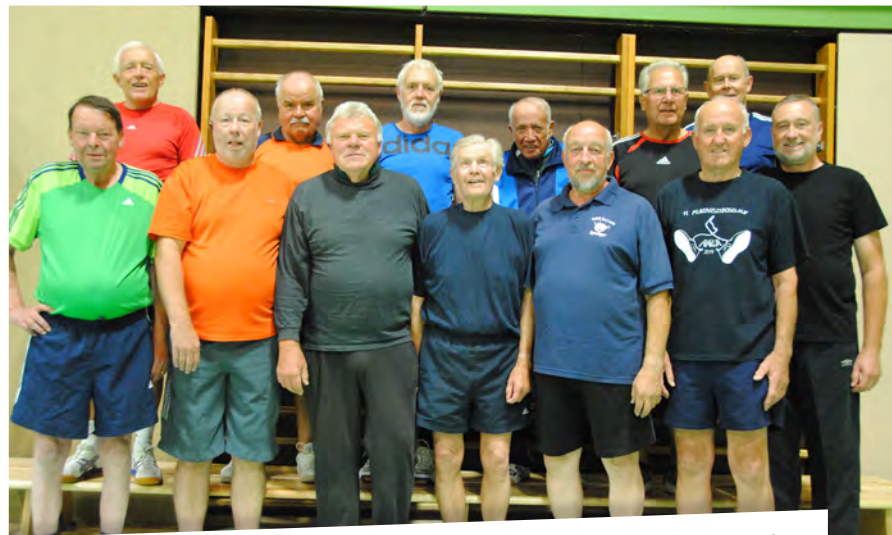
Herren Gymnastik • montags von 20.00 – 22.00 Uhr